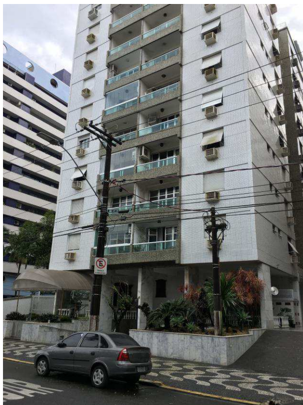
Figura 5: Outro ângulo.