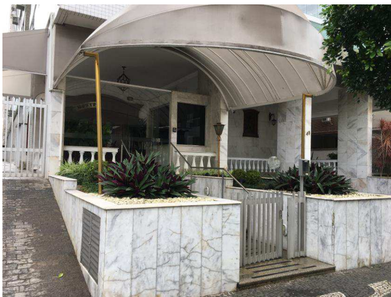
Figura 3: Acesso social.