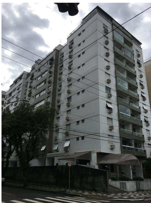
Figura 2: Vista geral do imóvel.