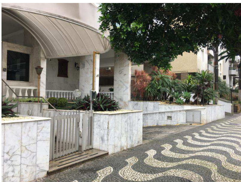
Figura 4: Acessos de serviço e autos.