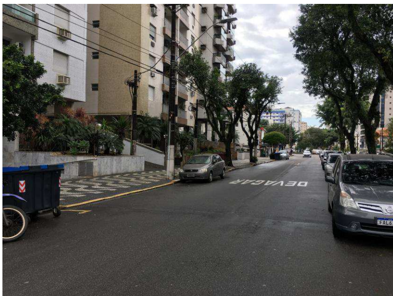
Figura 6: Vista da Avenida dos Bancários, sentido Avenida Dino Bueno.