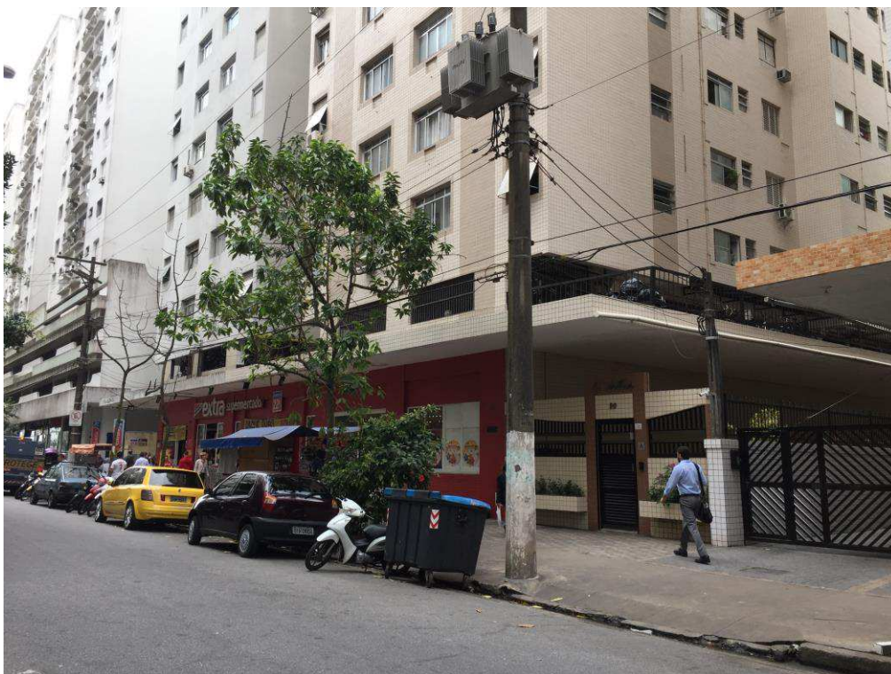
Figura 3: Vista da Rua Bassin Nagib Trabulsi, sentido praia.