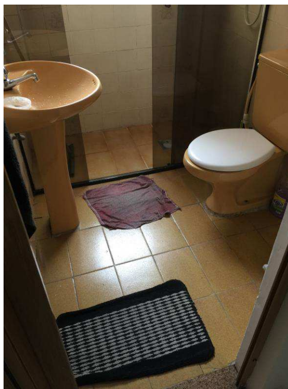
Figura 10: Banheiro.

Este documento é cópia do original, assinado digitalmente por EDUARDO LISBOA ROSA e Tribunal de Justiça do Estado de São Paulo, protocolado em 20/09/2018 às 15:04, sob o número WSTS18703258084. Para conferir o original, acesse o site https://esaj.tjsp.jus.br/pastadigital/pg/abrirConferenciaDocumento.do , informe o processo 1000399-19.2016.8.26.0562 e código 27C45F2.