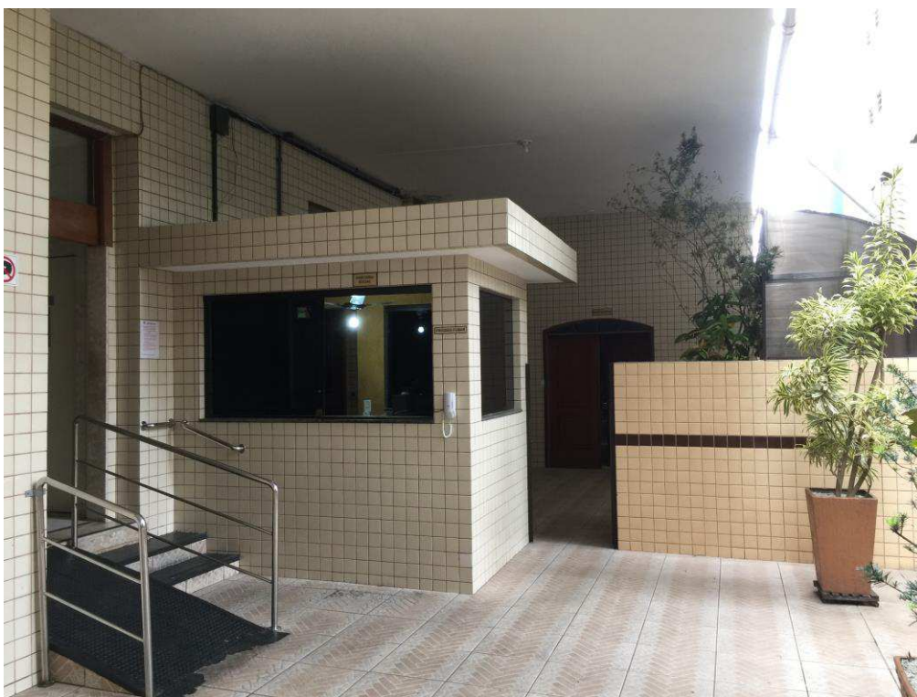
Figura 6: Guarita de controle de acesso.