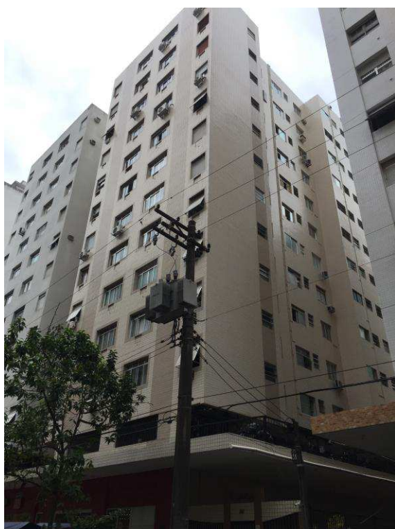
Figura 2: Vista geral do Edifício Antilhas

Este documento é cópia do original, assinado digitalmente por EDUARDO LISBOA ROSA e Tribunal de Justiça do Estado de São Paulo, protocolado em 20/09/2018 às 15:04, sob o número WSTS18703258084. Para conferir o original, acesse o site https://esaj.tjsp.jus.br/pastadigital/pg/abrirConferenciaDocumento.do , informe o processo 1000399-19.2016.8.26.0562 e código 27C45F2.