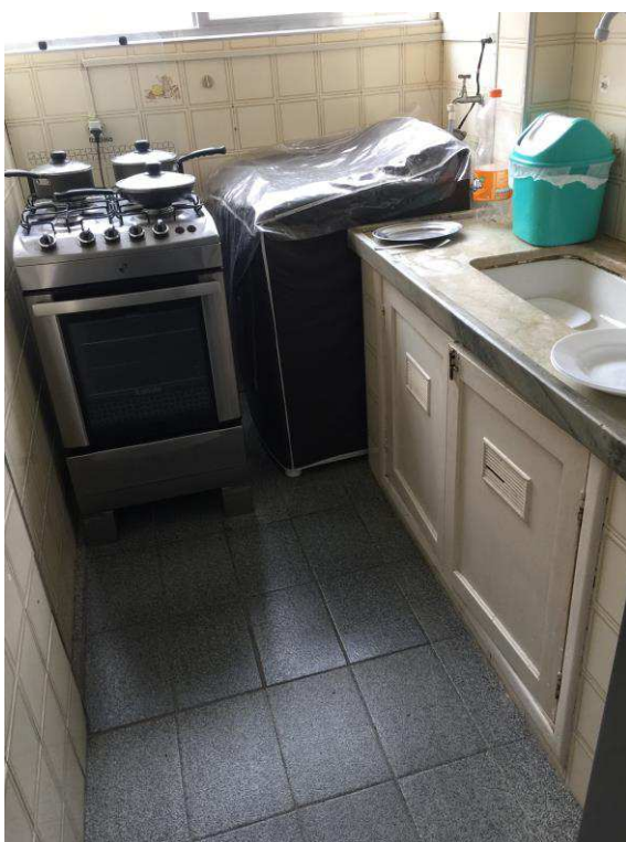
Figura 8: Cozinha.

10 Este documento é cópia do original, assinado digitalmente por EDUARDO LISBOA ROSA e Tribunal de Justiça do Estado de São Paulo, protocolado em 20/09/2018 às 15:04, sob o número WSTS18703258084 Para conferir o original, acesse o site https://esaj.tjsp.jus.br/pastadigital/pg/abrirConferenciaDocumento.do , informe o processo 1000399-19.2016.8.26.0562 e código 27C45F2.