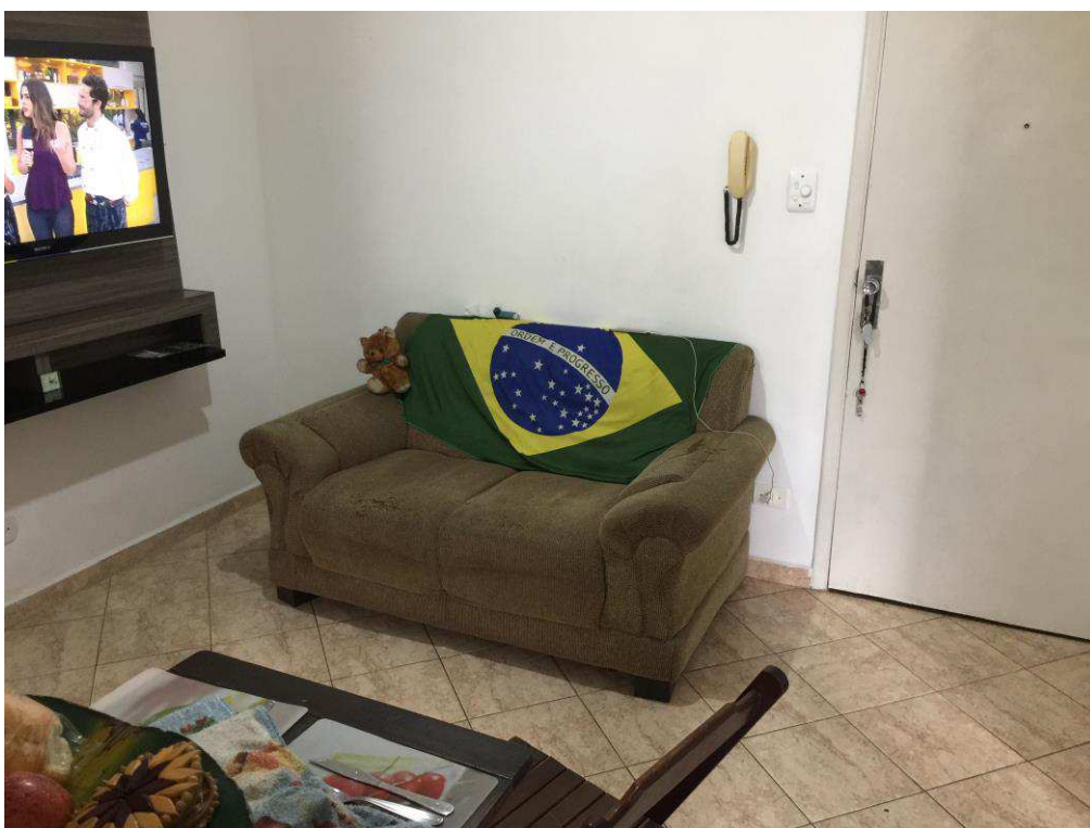
Figura 7: Sala.