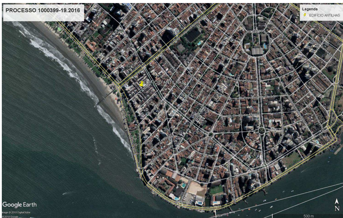
Figura 1: Em amarelo, a localização do objeto da avaliação.