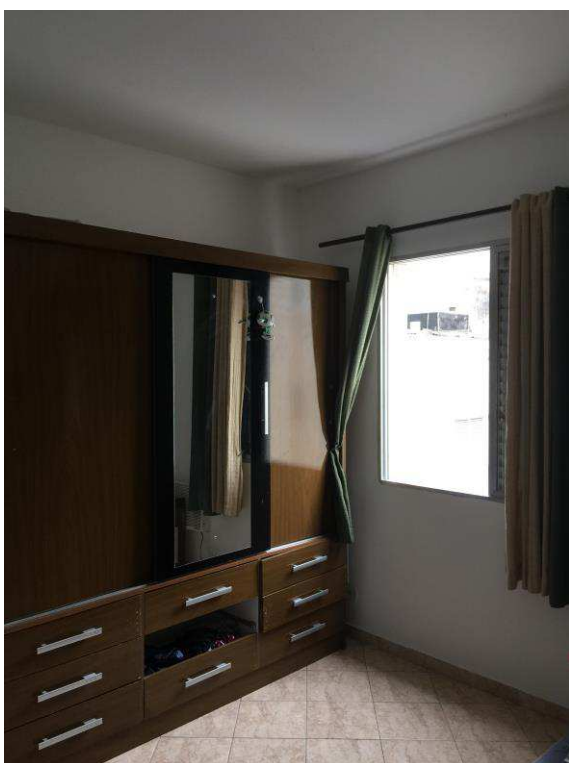
Figura 09: Dormitório.