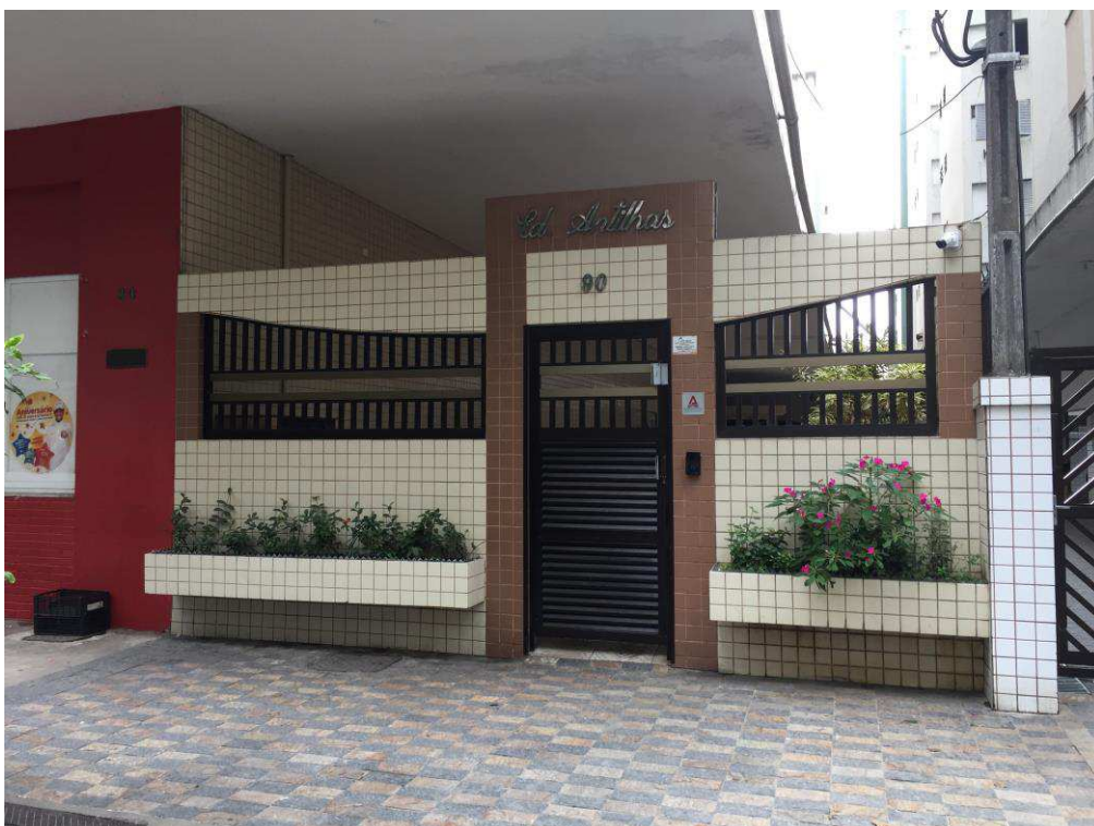
Figura 4: Vista do acesso social do Ed. Antilhas.