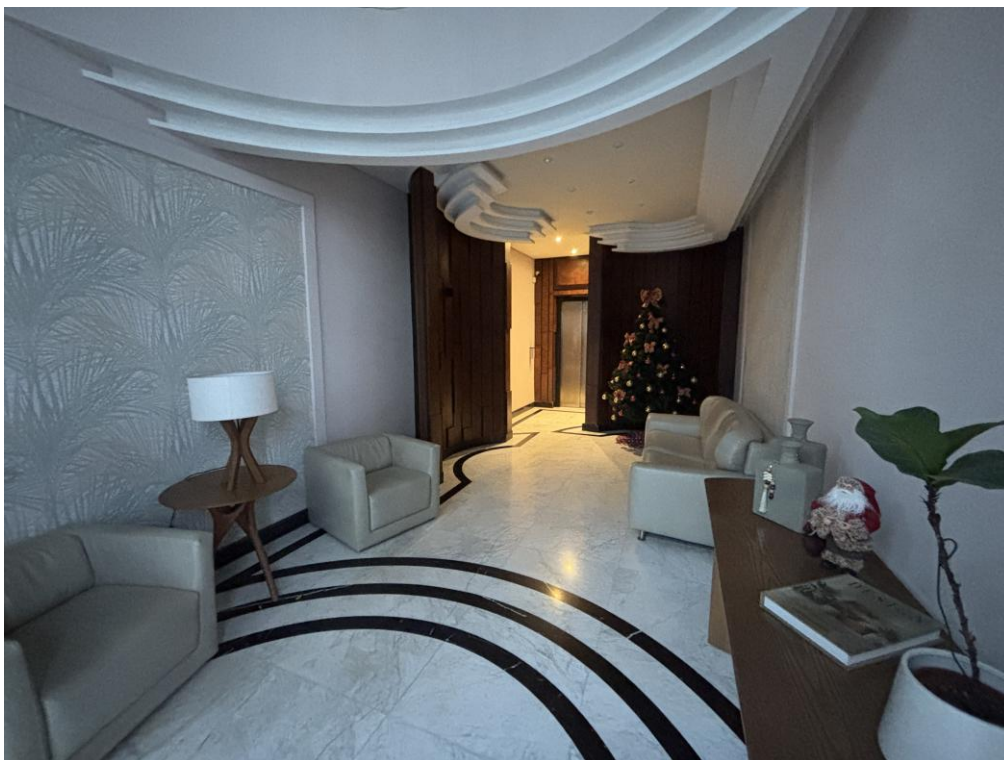
Figura 5: Hall de entrada.