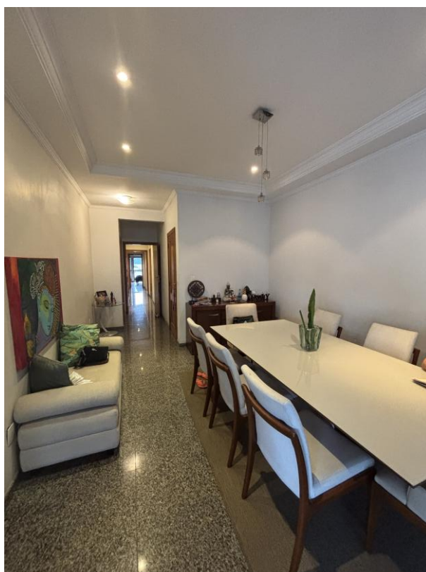
Figura 26: Sala de jantar.