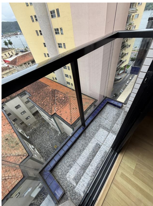
Figura 10: Suíte master, sacada.