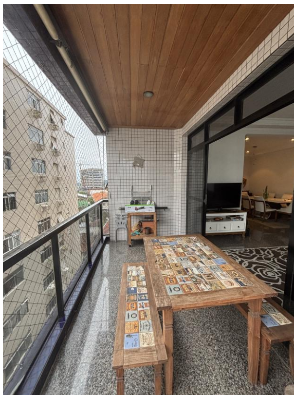
Figura 25: Varanda da sala de estar.