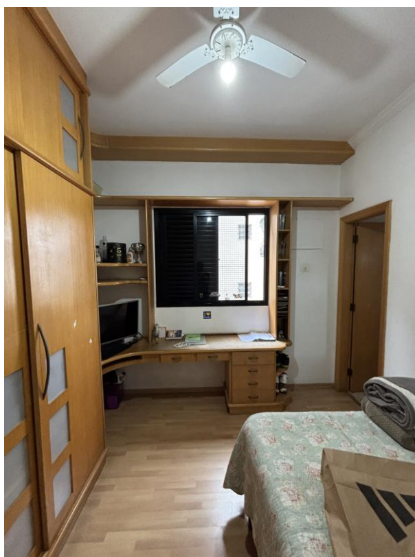
Figura 12: Suíte 1.