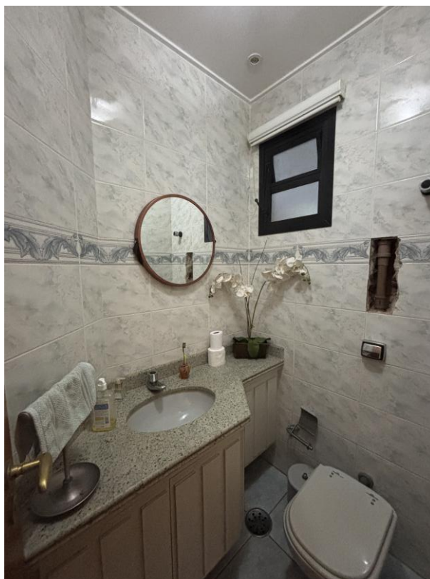
Figura 24: Lavabo.