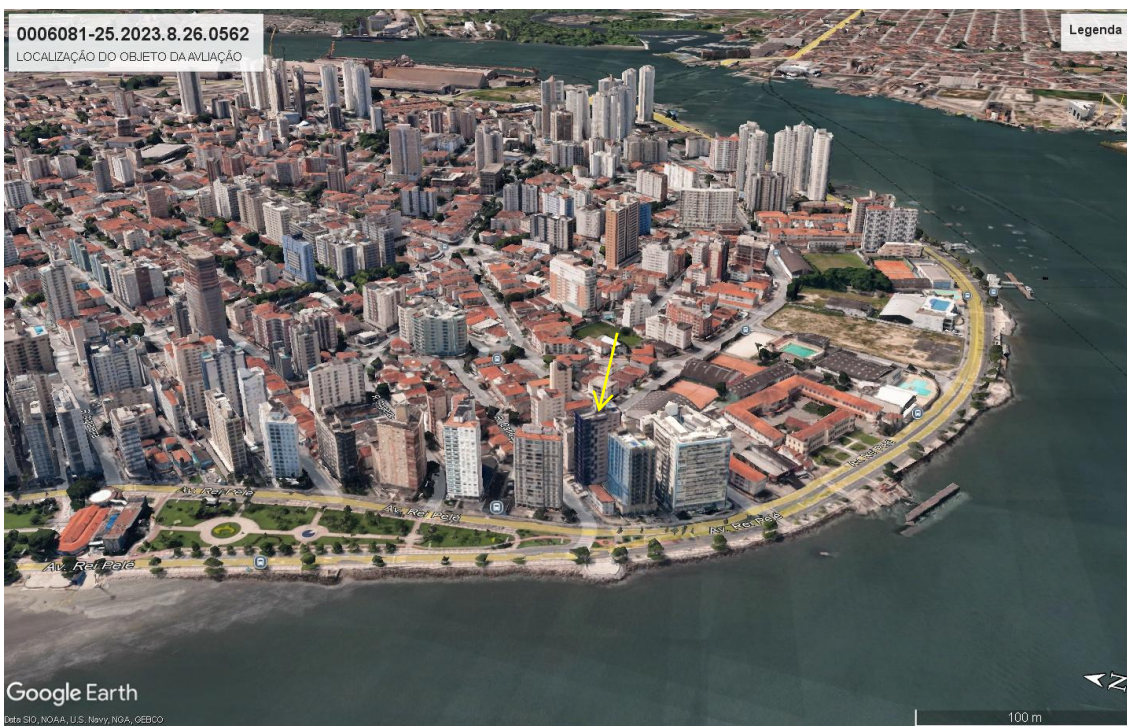
Figura 1: Seta amarela aponta para a localização do imóvel objeto da avaliação.