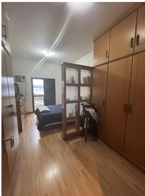
Figura 8: Suíte master.