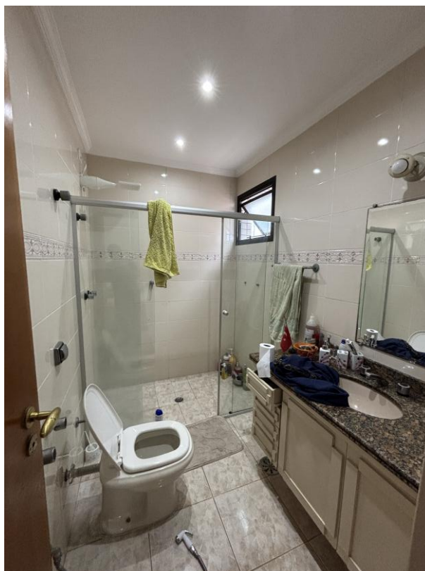
Figura 15: Banheiro privativo da suíte 2.