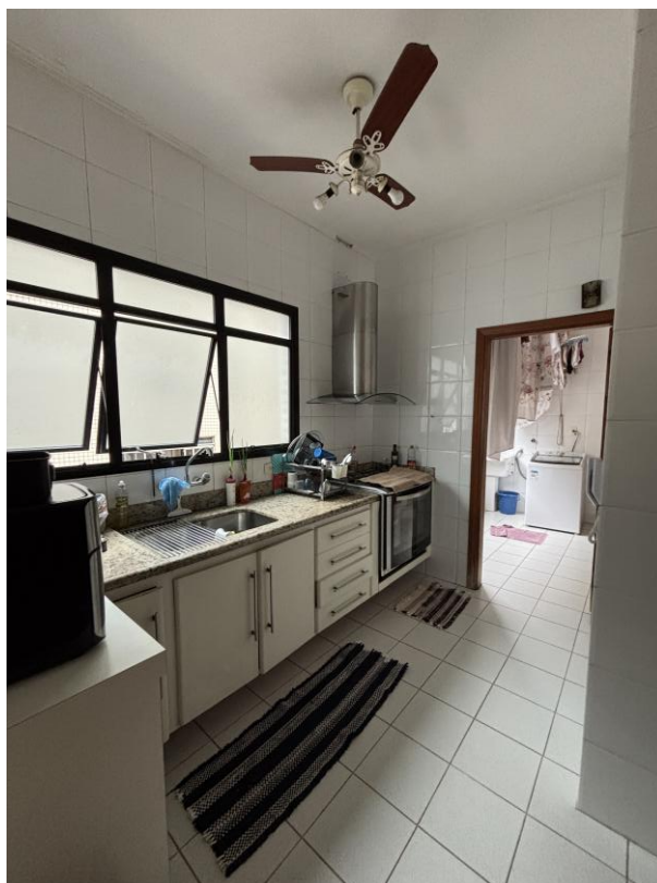
Figura 21: Cozinha