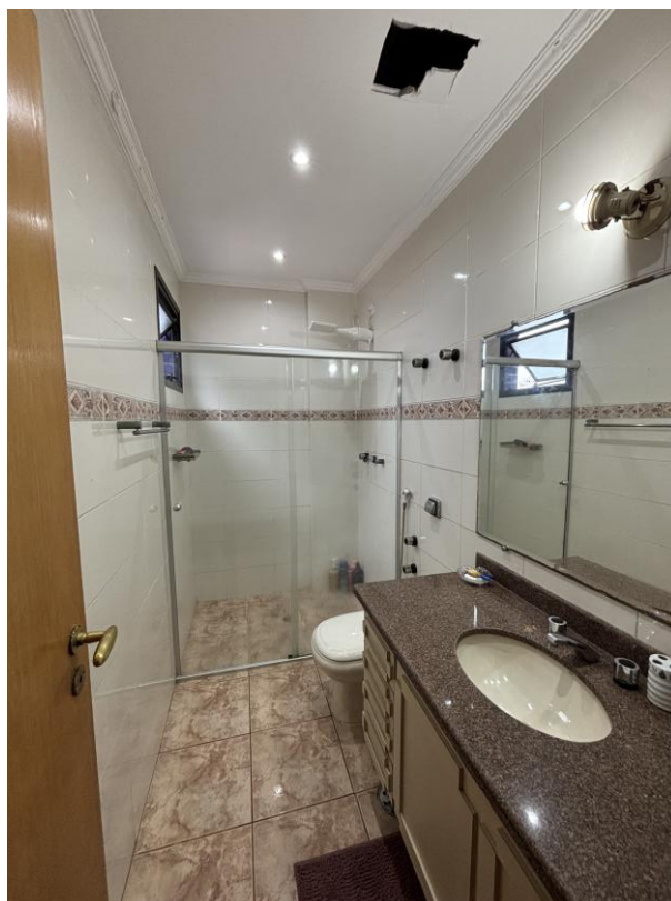
Figura 13: Banheiro privativo da suíte 1.