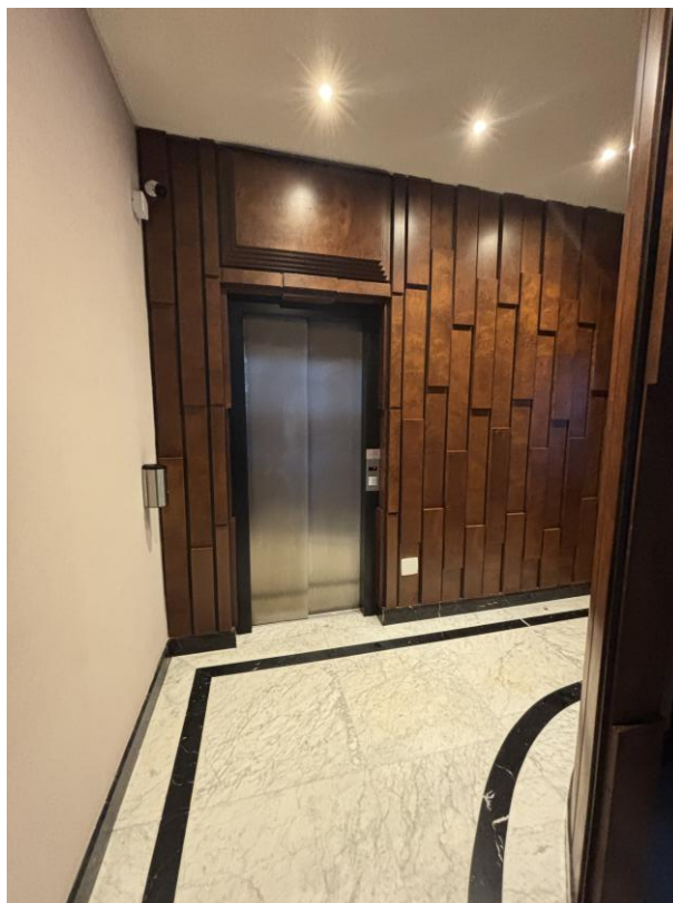
Figura 6: Hall do elevador social.