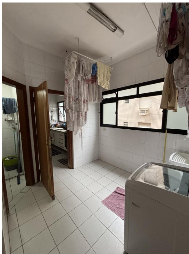
Figura 17: Área de serviços.