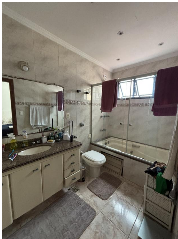
Figura 11: Banheiro privativo da suite master.