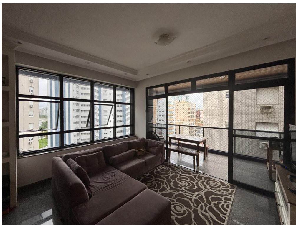
Figura 23: Sala estar.