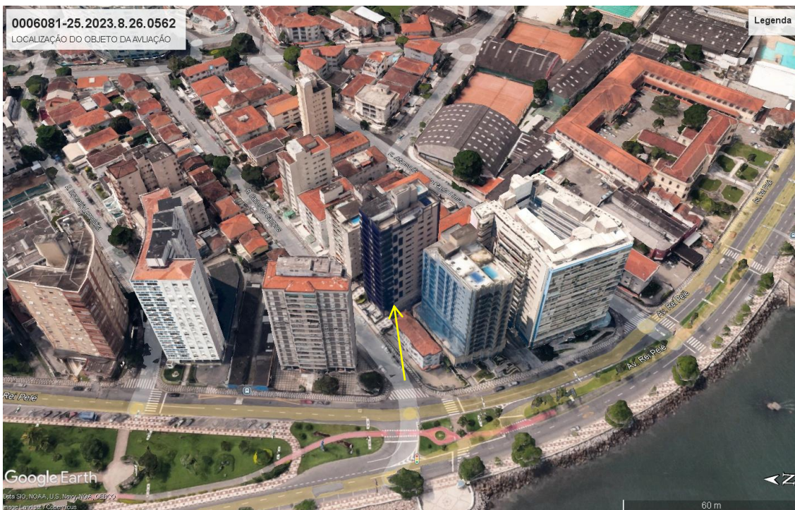
Figura 2: Num ângulo mais aproximado.