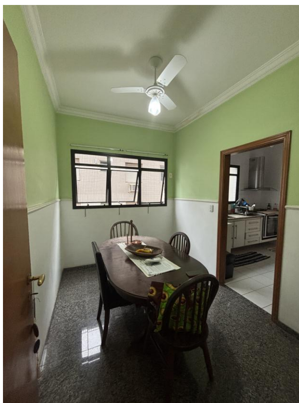
Figura 22: Copa, sala de refeições.