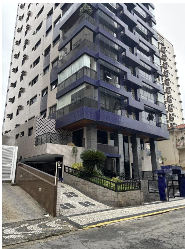
Figura 4: Acessos ao prédio.