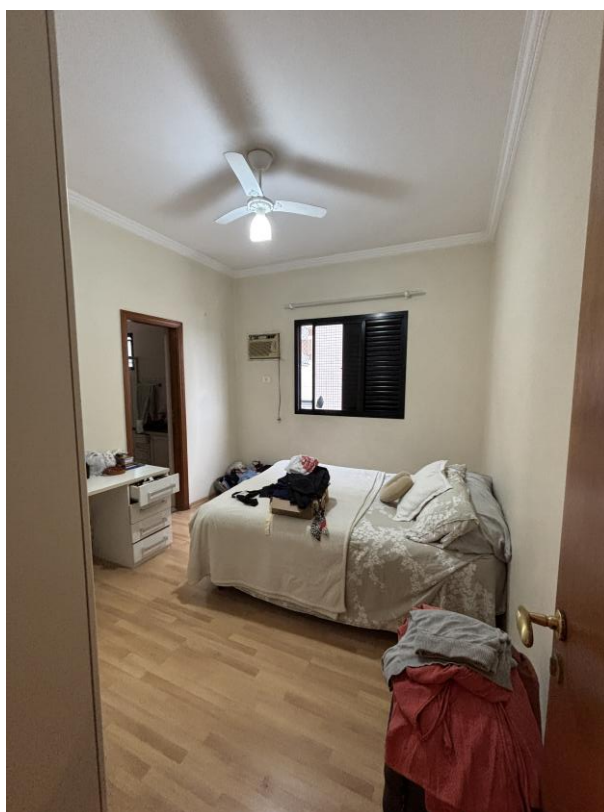
Figura 14: Suíte 2.