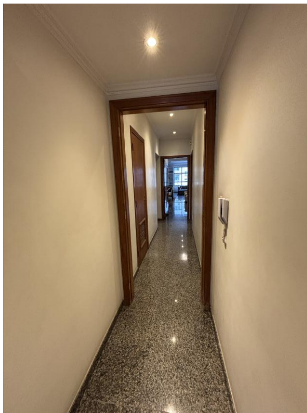
Figura 16: Corredor íntimo.