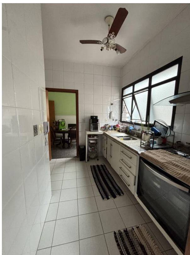
Figura 20: Cozinha.