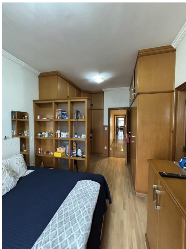
Figura 9: Suíte master, outro ângulo.