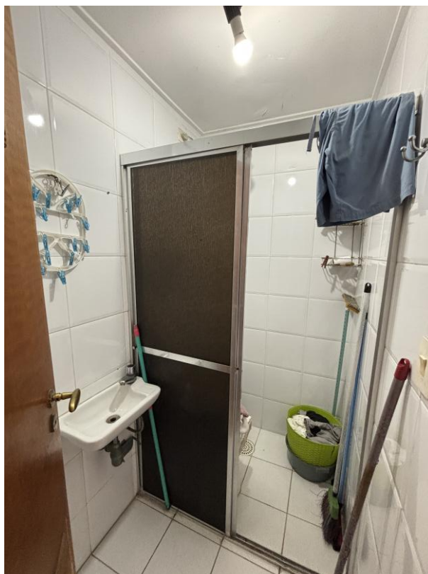
Figura 19: Banheiro de serviço.