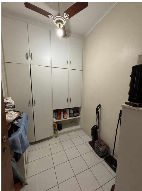
Figura 18: Quarto de serviço.