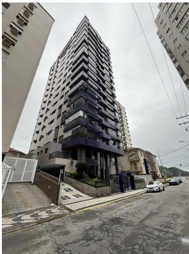
Figura 3: Vista geral do Edifício "Residencial Península".