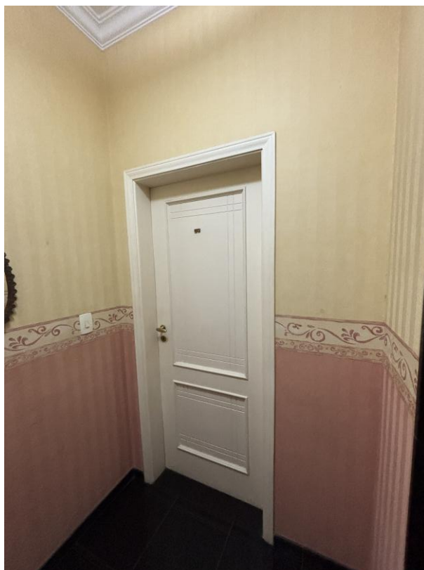
Figura 7: Hall dos apartamentos do andar.